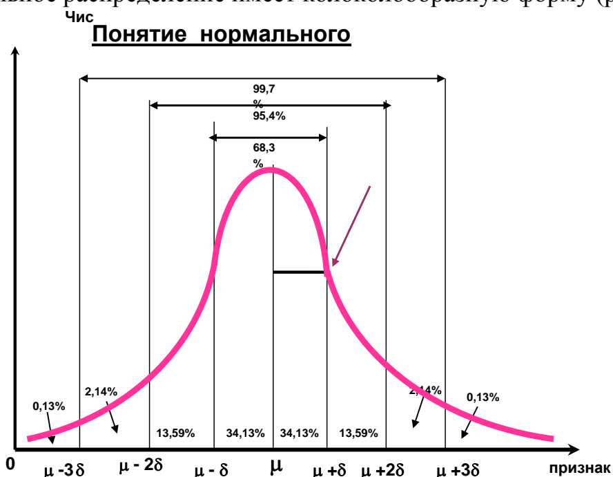
Рис. Кривая нормального распределения К.Гаусса

Нормальное распределение имеет колоколообразную форму (рис. 1).